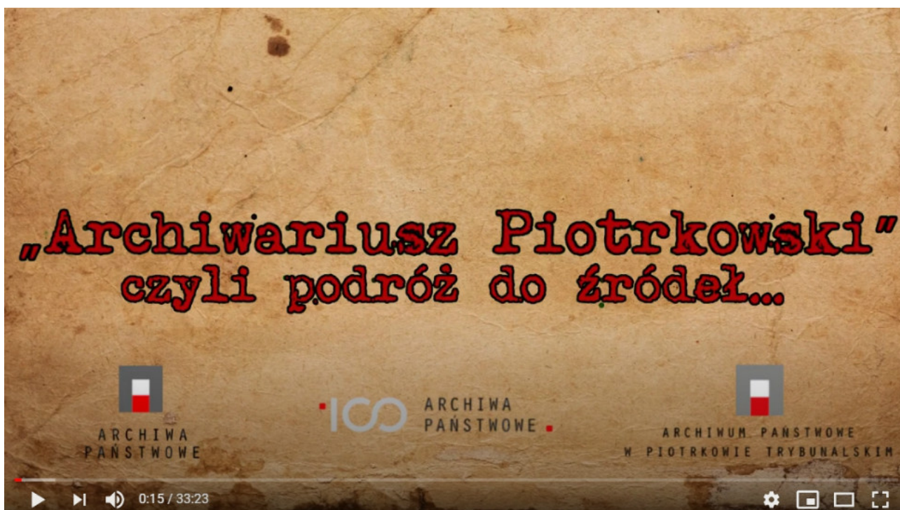
„Archiwariusz Piotrkowski, czyli podróż do źródeł...” (2019) – poznaj dzieje Archiwum Państwowego w Piotrkowie Trybunalskim. PREMIERA INTERNETOWA