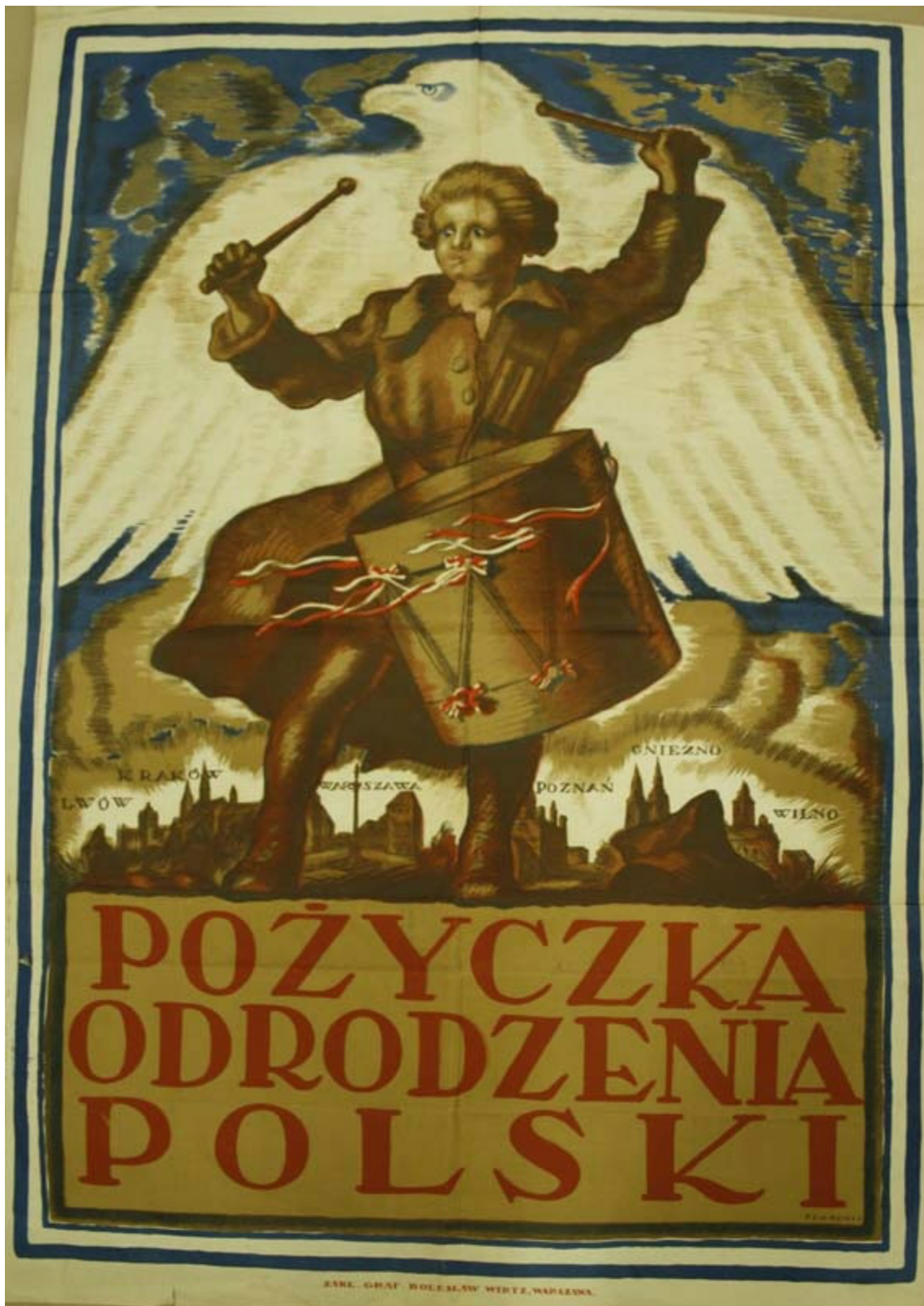
„Plakaty doby wojny polsko-rosyjskiej 1919-1921” - WYSTAWA WIRTUALNA