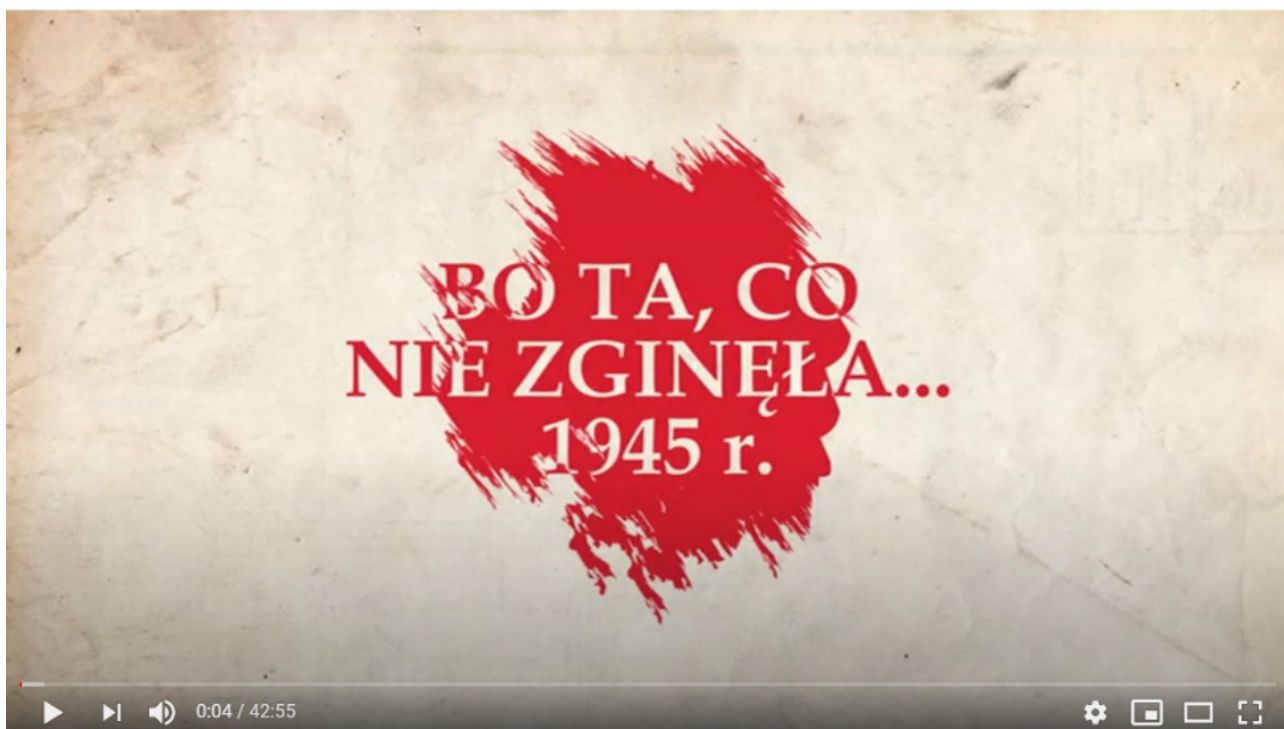
„Bo ta, co nie zginęła... 1945 r.” (2015) – fabularno-dokumentalny film ukazujący trudne realia, panujące po zakończeniu II wojny światowej. ZOBACZ TU

Materiał prezentujemy w związku z 75. Rocznicą zakończenia II wojny światowej. Film powstał w oparciu o materiały