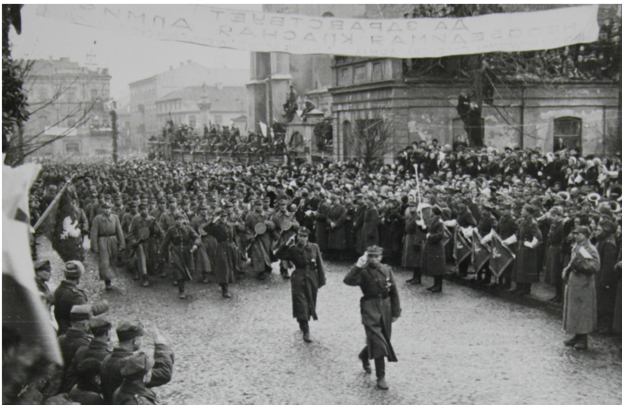
„75. rocznica zakończenia II wojny światowej” - WYSTAWA WIRTUALNA

My jednak pragniemy zachęcić Was do techniki łączącej postać tradycyjną z multimedialną innowacyjnością. Specjalnie z okazji tegorocznego MDA zapraszamy do zapoznania się z naszymi wystawami on-line. Nasze prezentacje dotyczą dwóch ważnych, historycznych rocznic obchodzonych w tym roku - 100. Rocznicy Bitwy Warszawskiej 1920 r. oraz 75. Rocznicy zakończenia II wojny światowej. Dodatkowo zachęcamy do nieodpłatnego pobrania wersji elektronicznych naszych wydawnictw, które zawierają kopie cyfrowe materiałów archiwalnych z zasobu Archiwum Państwowego w Piotrkowie Trybunalskim.